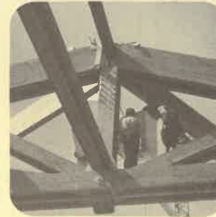
Centre sportif Carouge