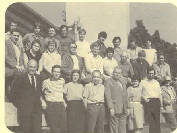
1984 Departement Charpente