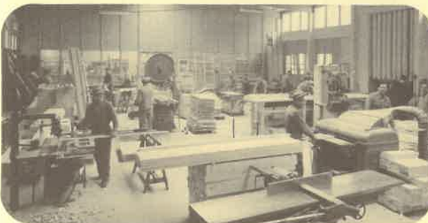
1980 Vue de l'atelier-machines à la Fontenette