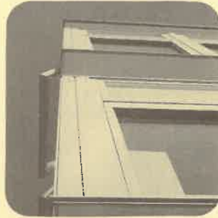
Détail façade bois-métal