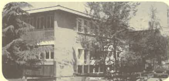
1954 nouvelle construction à la Fontenette