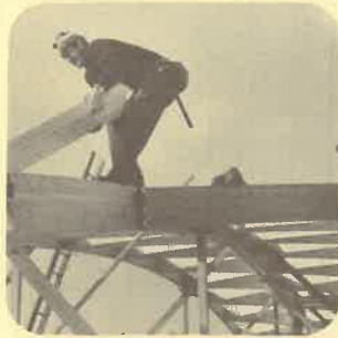
Eglise Charp. Hetzer