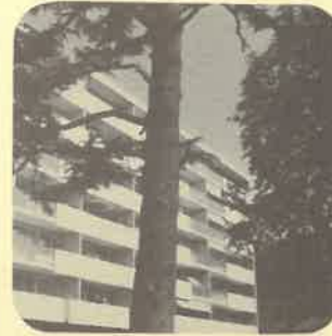
Vitrages Bât. Locatif