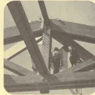
Centre sportif Carouge