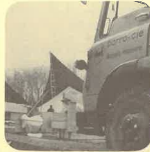
Expo 1964 Lausanne