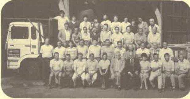
1984 Département Menuiserie